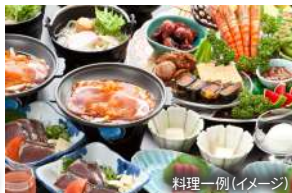
料理一例(イメージ)