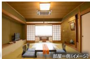
部屋一例(イメージ)