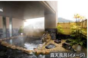
露天風呂(イメージ)