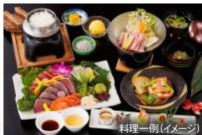
料理一例(イメージ)