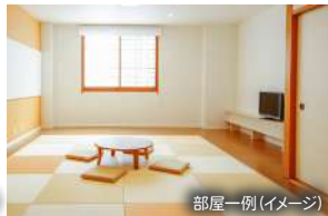
部屋一例(イメージ)