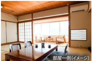
部屋一例(イメージ)