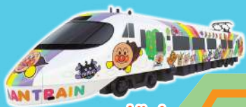
岡山・高松⇨松山 予讃線8000系 アンパンマン列車