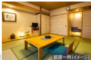
部屋一例(イメージ)