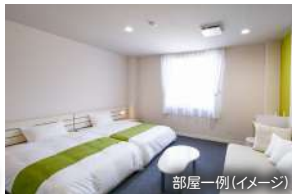
部屋一例(イメージ)