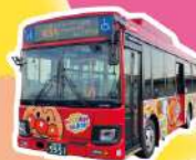
◀ アンパンマンバス