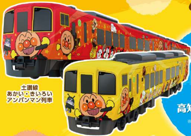
土讃線 あかい○きいろい アンパンマン列車

ゆき・かえりとも 特急列車普通車指定席利用 アンパンマンシートにも乗車可能! ※満席などでご予約いただけない場合がございます。