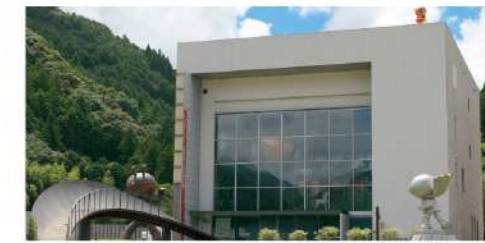
アンパンマンミュージアム外観