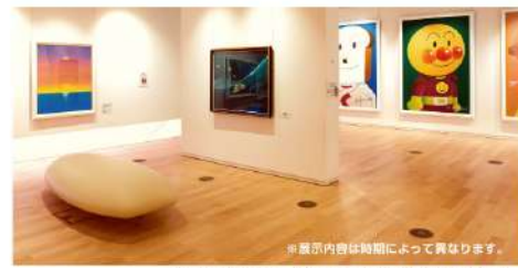
アンパンマンミュージアム 4階 やなせたかしギャラリー