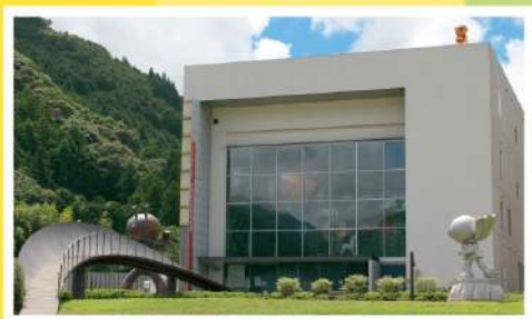
▲ やなせたかし記念館 アンパンマンミュージアム