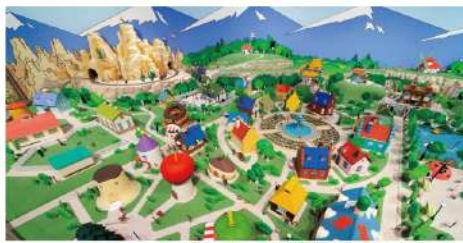
アンパンマンミュージアム 地下アンパンマンワールド