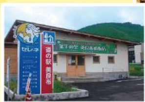
▲ 葦生の里 美良布直販店