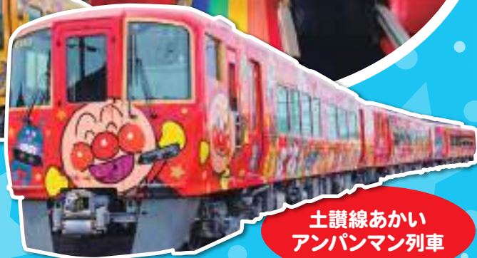
土讃線あかい アンパンマン列車