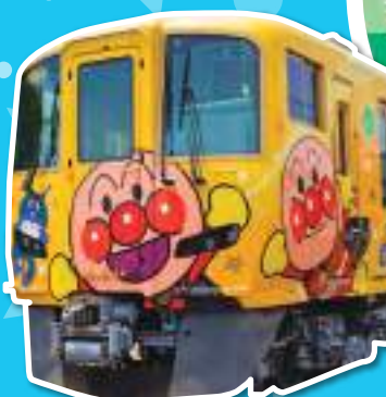
土讃線きいろい アンパンマン列車