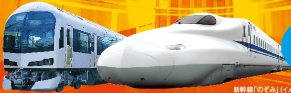
新幹線「のぞみ」(イメージ)