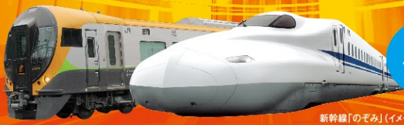
新幹線「のぞみ」(イメージ)