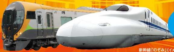
新幹線「のぞみ」(イメージ)