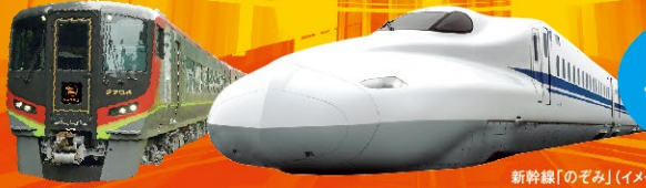
新幹線「のぞみ」(イメージ)