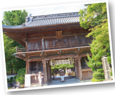
貸切タクシープラン

◆旅行代金(おひとり様) 2名様1室 290,000円 1名様1室 330,000円 ※相部屋不可 ◆お食事条件 朝食 10回 ・夕食 10回 ◆出発日 2024年 5月16日(木) ・ 9月19日(木) 11月7日(木) ◆募集人員 各日 8名 (最少催行人員:各日4名)