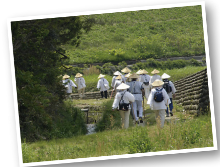
※宿泊施設は記載された施設又は同等クラス

◆旅行代金(おひとり様) 2名様1室 310,000円 1名様1室 350,000円 ※相部屋不可 ◆お食事条件 朝食 11回 ・夕食 11回 ◆出発日 2024年 4月17日(水) ・ 6月12日(水) ・ 10月9日(水) ◆募集人員 各日 8名 (最少催行人員:各日4名)