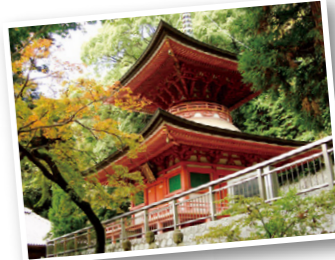
※宿泊施設は記載された施設又は同等クラス

◆ご旅行代金(おひとり様) 2名様1室 310,000円 1名様1室 350,000円 ※相部屋不可 ◆お食事条件 朝食 11回 ・夕食 11回 ◆出発日 2024年 9月4日(水) ・ 10月16日(水) ・ 11月13日(水) ◆募集人員 各日 8名 (最少催行人員:各日4名)