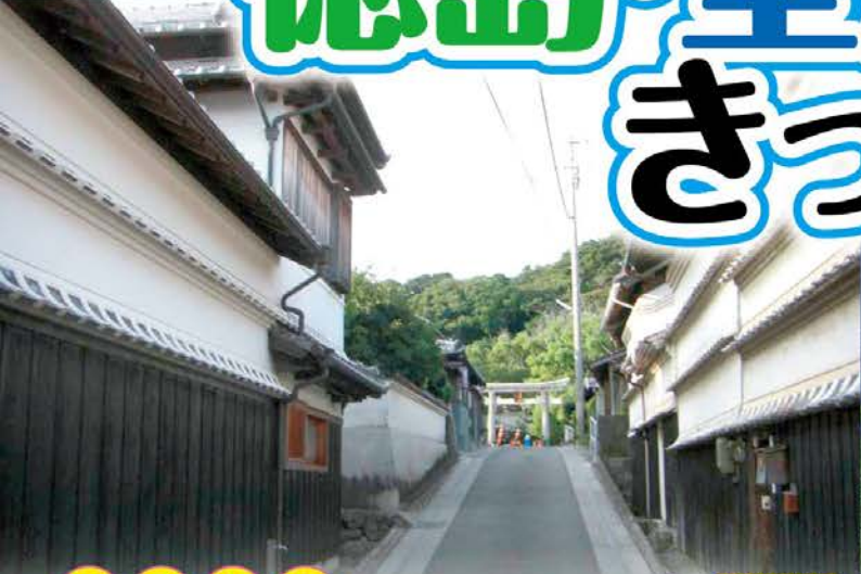
吉良川のまちなみ